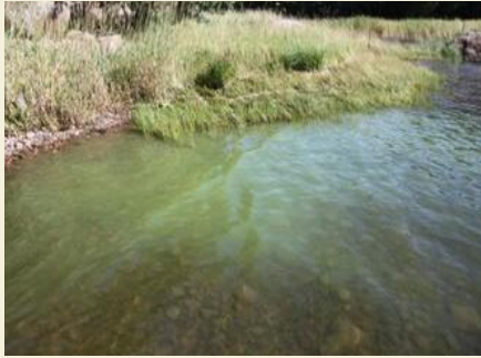
Erittäin runsaasti sinilevää